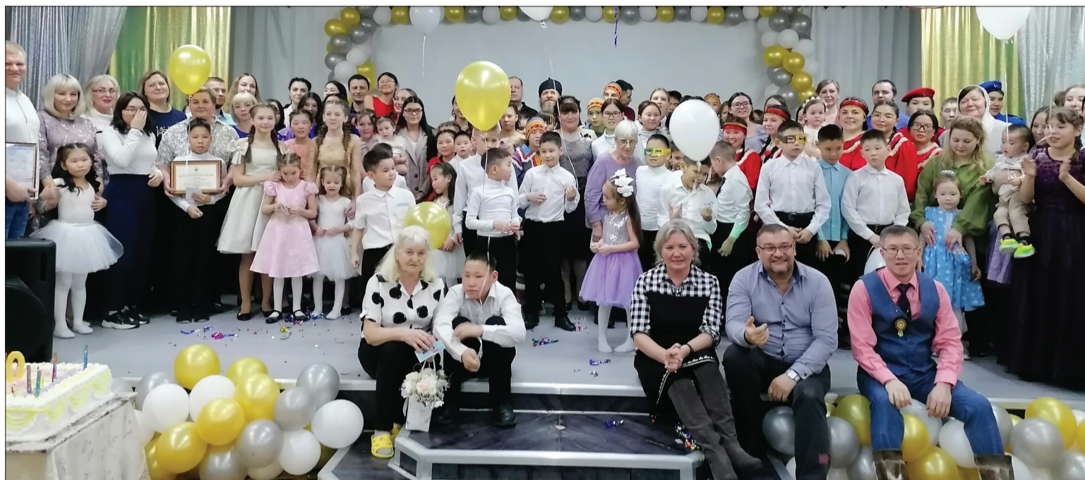
В Ванаварском детском доме сегодня воспитывается 69 детей