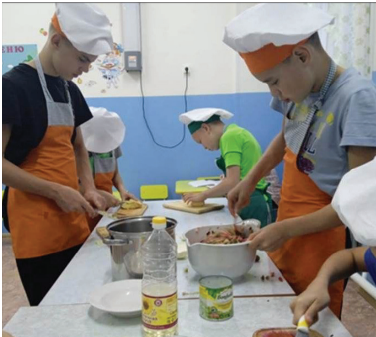
📷 Будущий мужчина должен уметь все