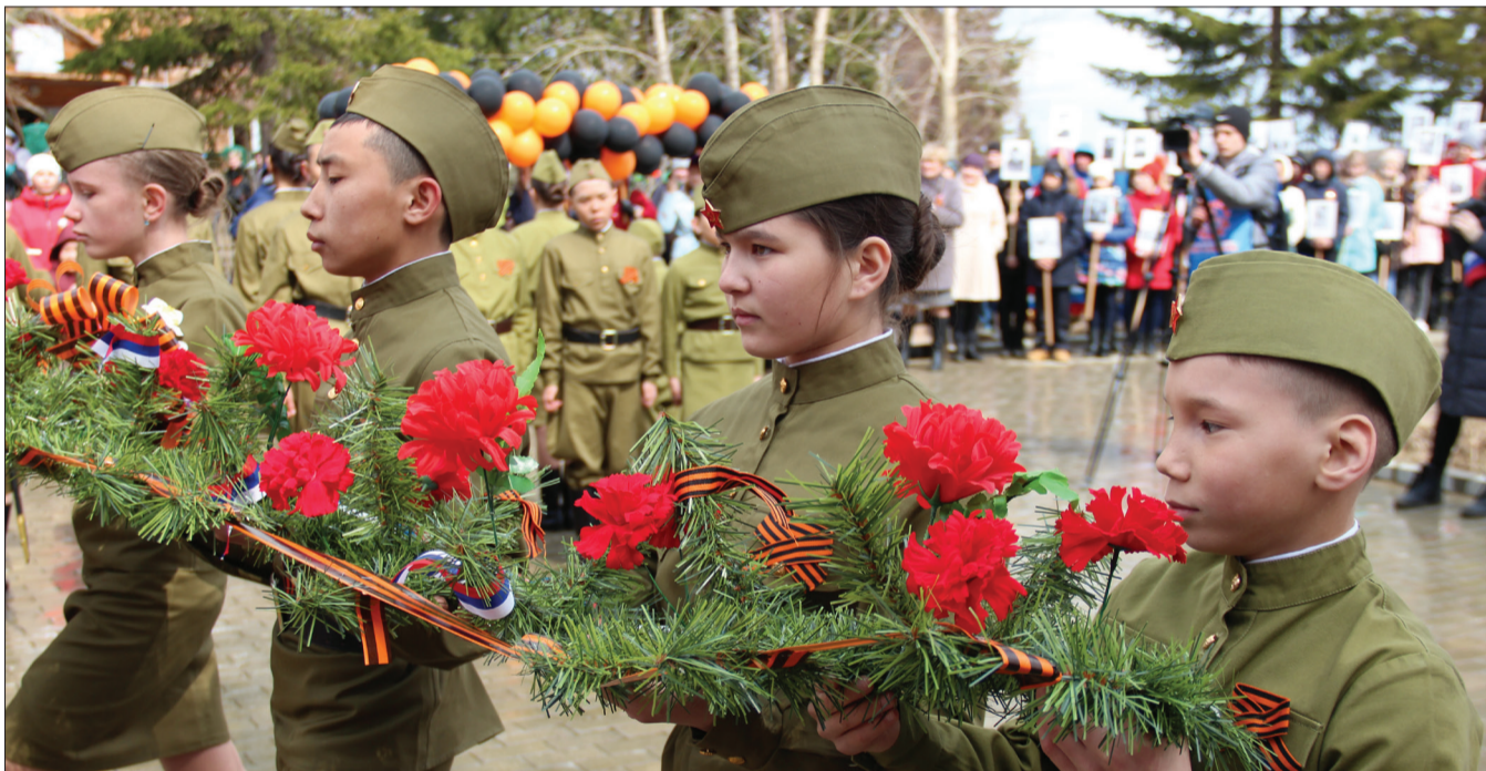
📷 Особое внимание уделяется патриотическому воспитанию

щают Божественную литургию в храме вместе со своими воспитателями и крестными.