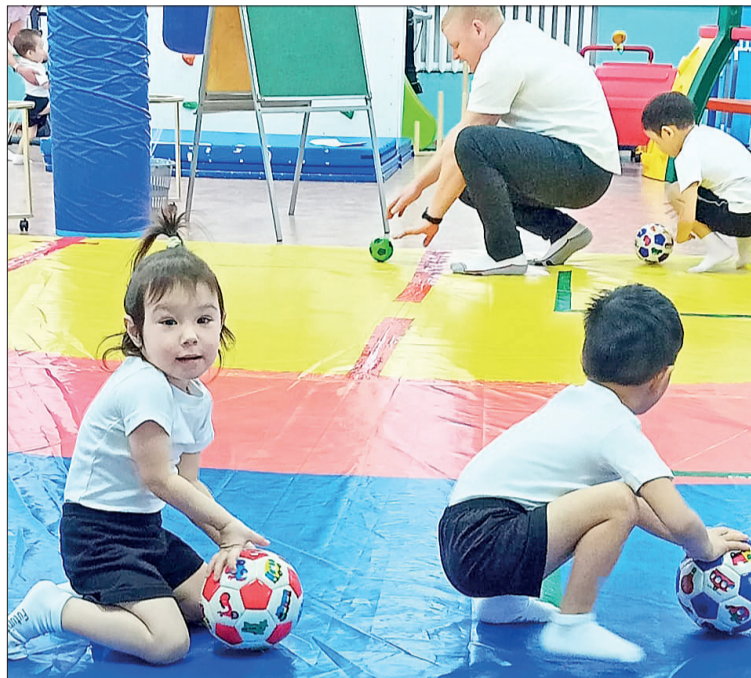
📷 Спорт здесь любят