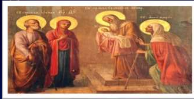
Сретение по-старославянски «встреча».

В этот день впервые принесли Иисуса Христа в храм Иерусалимский, дабы почтить закон Моисея (Лев. 12). Согласно этого закона, мать, родившая мальчика, на 40-й день жизни приносила его в Храм для посвящения Богу. Родители также приносили благодарственную жертву - однолетнего ягненка или голубей.