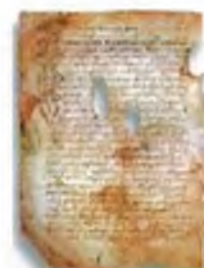
Псковская судная грамота

Двинская уставная грамота 1397 года. Мздоимство упоминается в русских летописях XIV века, например в Двинской уставной грамоте 1397 года в статье 6: «А самосуда четыре рубли, а самосуд то: кто изыснав татя с поличным, да отпустит, а себе посул возьмет, а наместники доведаются по заповеди, ино то самосуд, а опричь того самосуда нет». Там же, в статье 8: «...а черес поруку не ковати, а посула в железех не просити; а что в железех посул, то не в посул».